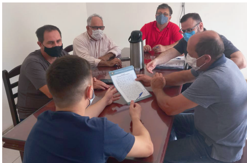
Mais ativas e participativas, as Comissões Permanentes se reúnem regularmente às sextas-feiras que antecedem as Sessões Ordinárias