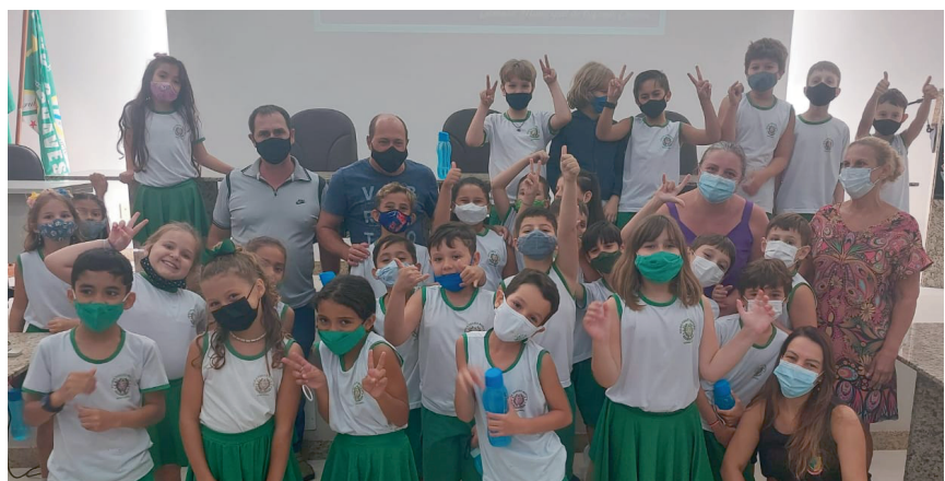
As turmas do 4º ano matutino (foto 1) e do 3º ano I (foto 2) da EMEF Ana Araújo foram as primeiras a participarem do projeto após sua retomada

Suspensa desde 2020 por conta da pandemia da Covid-19, o Projeto "Visita à CMAC" agora está de volta. Por meio dessa iniciativa, instituições de ensino podem trazer os alunos para conhecer a sede da Câmara Municipal de Alfredo Chaves e estimular o exercício da cidadania. Durante a visita, monitorada por servidores da Casa, são realizadas apresentações sobre o funcionamento do órgão, principais atividades e funções do Poder Legislativo Municipal, além da visita aos espaços físicos da Câmara, incluindo o Plenário e gabinetes dos vereadores. O conteúdo e a metodologia de cada apresentação são adaptados conforme a faixa etária e a série escolar dos alunos. O agendamento é feito por telefone e mediante envio de ofício pela instituição.